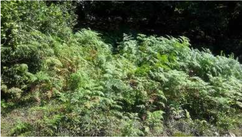
50 მ 3 მოცულობის რეზერვუარის განთავსების ადგილი