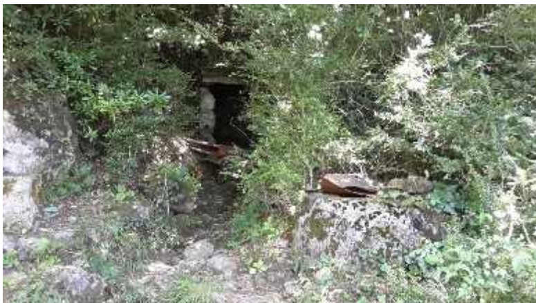
სოხასტერის წყაროს კაპტაჟი