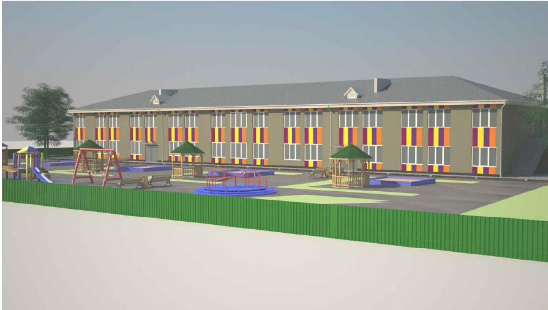
პროექტის რენდერი M 1:100

ქ. ხაშურში, თამარ მეფის ქუჩაზე პროექტი #7 საბავშვო ბაღი