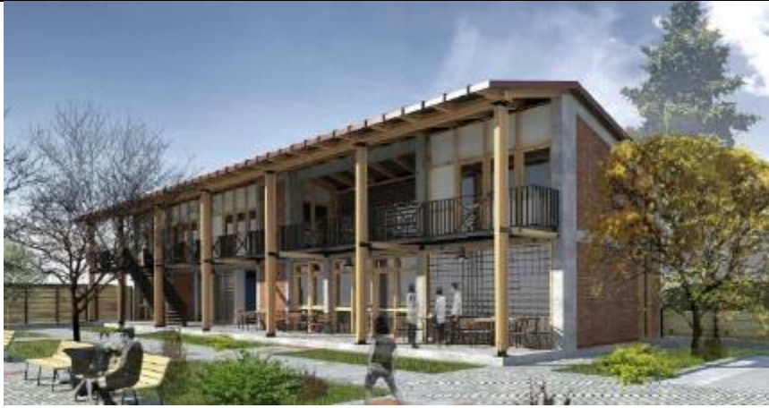
Visitor Center, renders