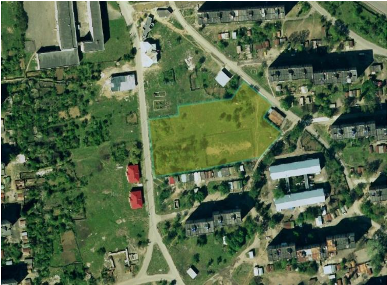
გამოსახულება 2 საპროექტო ტერიტორიის ფოტოები 1