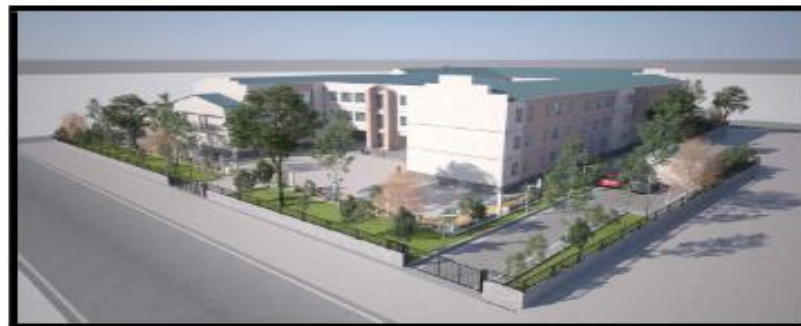
RENDER 2 ჩვენი 2