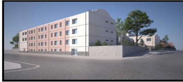
FIGURE 6 Figure 6