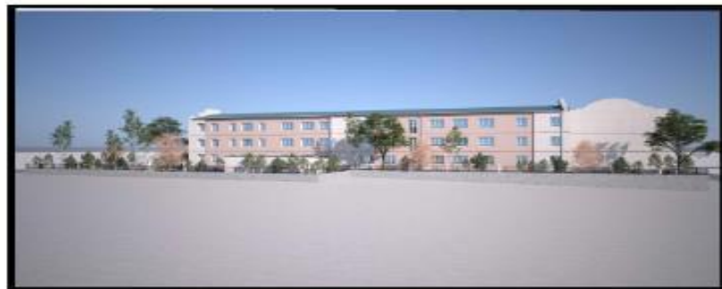
RENDER 3 ჩვენი 3