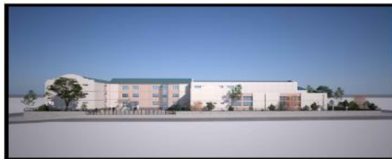
RENDER 4 ჩვენი 4