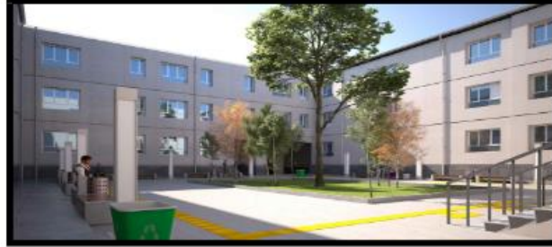
FIGURE 8 Figure 8