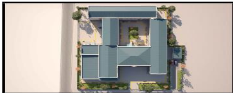
RENDER 1 ჩვენი 1