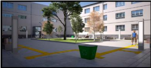
FIGURE 7 Figure 7