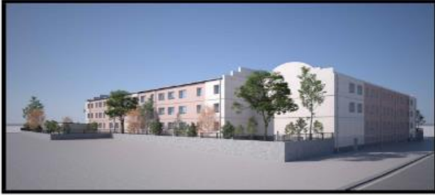
FIGURE 5 Figure 5