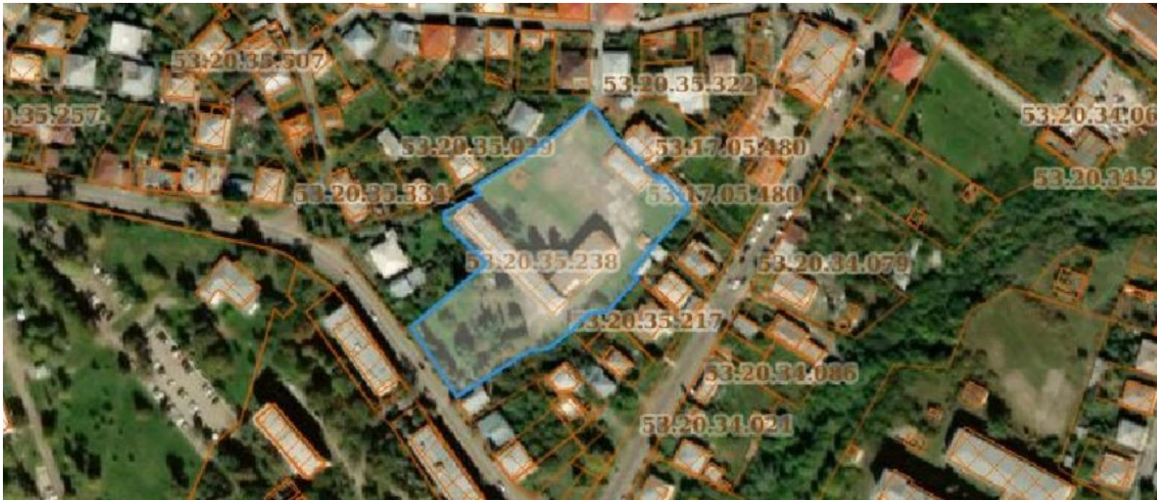
დანართი 1: ორთოფოტო