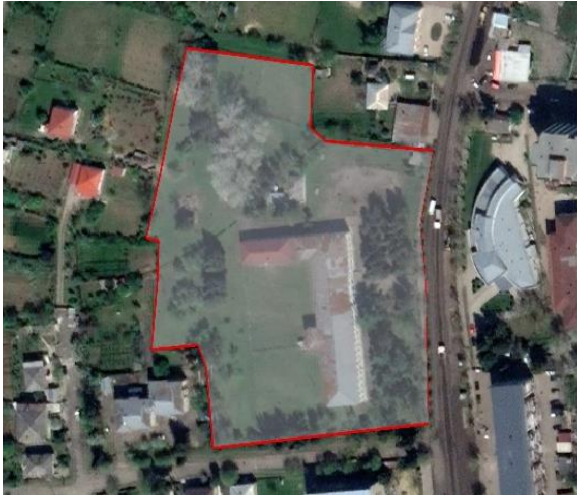
დანართი 1: ორთო. ფოტო