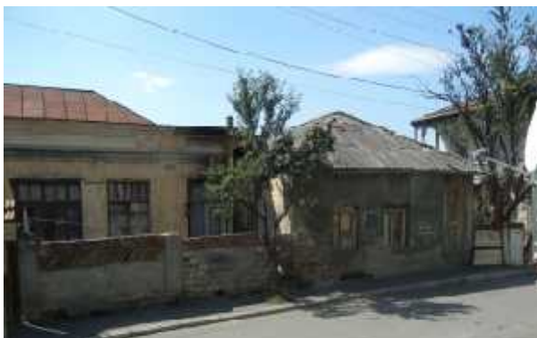
ნაზი შამანაურის ქუჩა # 14

შენობა წარმოადგენს ერთსართულიან აგურით ნაშენ უსახო ნაგებობას რომელიც მოგვიანებით გალესილია და გადახურულია აზბესტის შემცველი ტალღოვანი შიფერით. შენობა ავარიულია და საჭიროებს სერიოზულ კონსტრუქციულ სამუშაოებს.