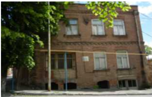
შამანაურის ქუჩა #12

ორსართულიანი ძველი რუსული აგურით ნაგები შენობა, მდებარეობს შამანაურის და რუსთაველის ქუჩების კუთხეში, დახურულია თუნუქით. შენობას აქვს საკმაოდ ვრცელი სარდაფი, სადაც