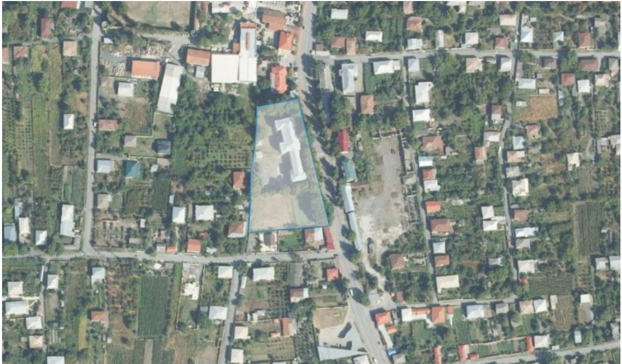
დანართი 1: ორთო ფოტო